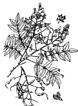
图8 今《中药大辞典》 槐图