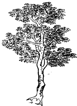
图5 明《本草原始》 槐木图