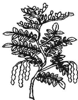
图1 北宋《本草图经》 高邮军槐实图