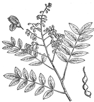
图7 今《全国中草药汇编》 槐图