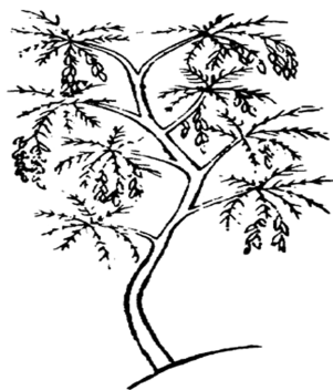
图3 明《本草蒙筌》 槐实图