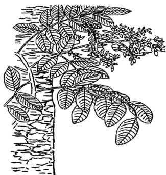
图6 清《植物名实图考》 槐图