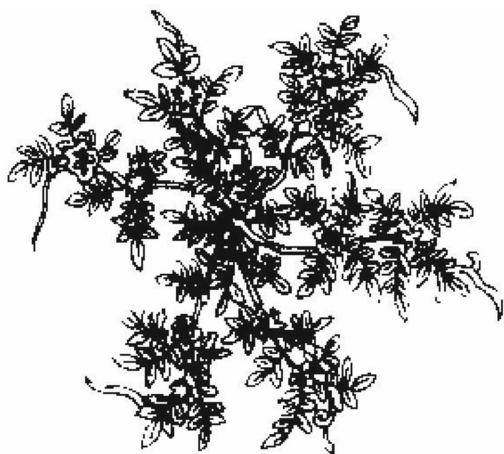
图1 《本草图经》秦州蒺藜图

名实图考》蒺藜图(图3),所绘均与今《中华本草》蒺藜图(图4)相吻合。因此,历代古本草所载中药蒺藜(子)的原植物来源是今蒺藜科植物蒺藜。