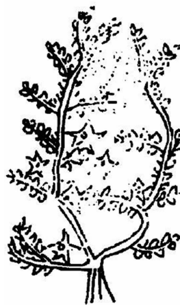
图2 《本草纲目》蒺藜图