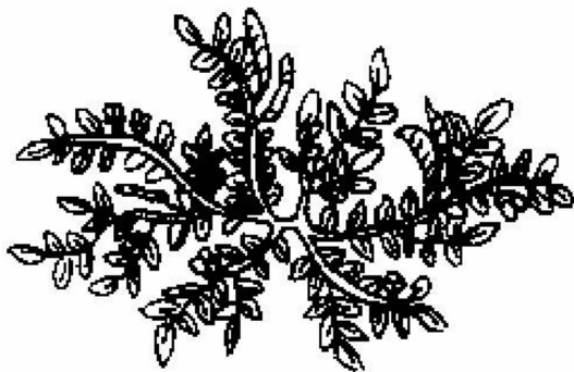
图 6 《全国中草药汇编》扁茎黄芪图

扁茎黄芪 Astragalus complanatus R. Brown, 其干燥成熟种子现作药用,药品正名为沙苑子(别名潼蒺藜、蔓黄芪、夏黄草、沙苑蒺藜),而不作蒺藜用。