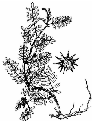
图4 《中华本草》蒺藜图

然在古本草文献中,多有将蒺藜与沙苑子(沙苑蒺藜)相混淆的记载。《本草图经》在蒺藜条下记载了一种白蒺藜,文曰:“又一种白蒺藜,今生同州沙苑(今陕西大荔县南),牧马草地最多,而近道亦有之,绿叶细蔓,绵布沙上;七月开花,黄紫色,如豌豆花而小;九月结实、作荚,子便可采。其实味甘而微腥,褐绿色,与蚕种子相类而差大,又与马藻子酷相类,但马藻子微大,不堪入药,须细辨之,今人多用。” [10] 其后的本草文献多承袭此说,将白蒺藜与蒺藜作为一类二种而记载,如《本草衍义》曰:“蒺藜,有两等……又一种白蒺藜,出同州沙苑牧马处。黄紫花,作荚,结子如羊内肾。补肾药,今人多用。” [17] 《本草蒙筌》曰:“蒺藜子:多生同州沙苑,亦产近地道旁。牧马草场,布地蔓出。” [13] 《本草纲目》曰:“其白蒺藜结荚长寸许,内子大如脂麻,状如羊肾而带绿色,今人谓之沙苑蒺