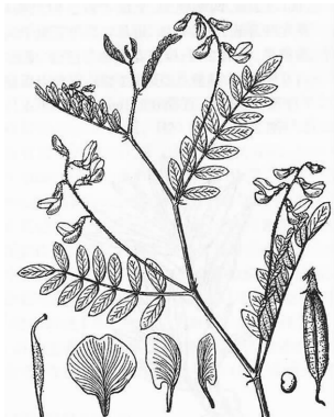
图 5 《本草图经》同州白蒺藜图

在凹入一侧有明显的种脐。” [22] 再比较《本草图经》同州白蒺藜图(图 5)与《全国中草药汇编》扁茎黄芪图(图 6),二者相类似,可见,古本草文献所载之白蒺藜,其原植物应是今天豆科黄芪属植物